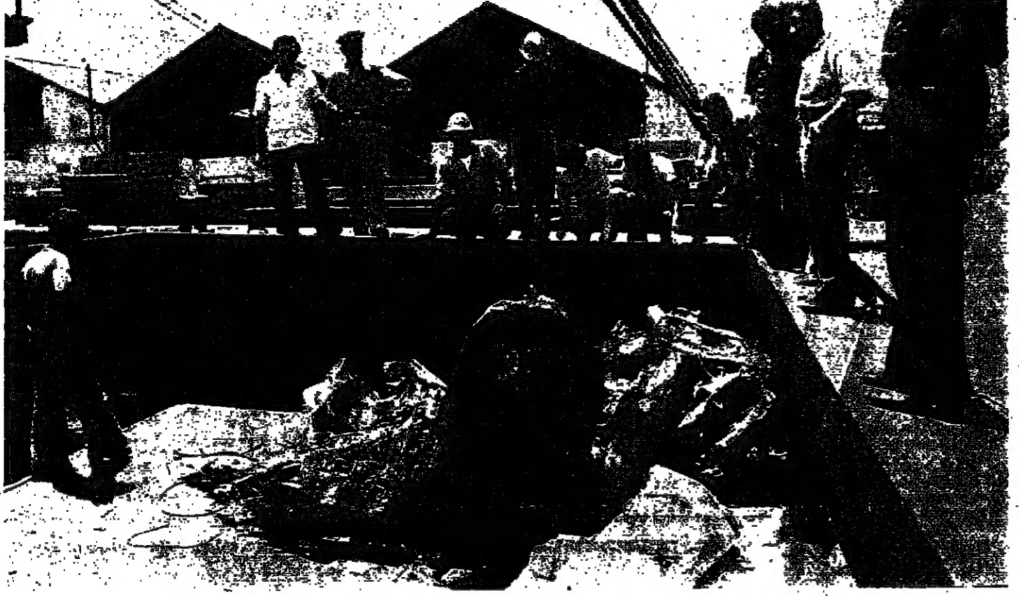
عظام الطائرة بعد اكتشافها في المرفأ امس

انتصار السادات خطوة خطوة انظروا الرئيس السادات من الشرق تجاههم من الغرب . لم يرد على الاسئلة التي طرحوها ونصروا اجوبتها مسبقاً ، بل رد على المسئلة التي اوردوا طرحها لكن الكتاب يقرأ من عنوانه . ولعل السادات رد على المقترحات الاسرائيلية الاخرى حول التسوية الحرب ، اي الطريقة غير المباشرة في سيناء على طريقة هينيل في سنة ١٩٦٧ . فقد ارجا اتخاذ قرار حول موضوع قوات الطوارئ معتبراً ان نداء مجلس الامن لا ينبغي ان يكون مجرد تصاهة ورق تضايق السي الكا تصالحت الورق المكسرات القلبية الدولية . لك ان مهمة المجلس هي ضمان تطبيق القرارات لا التوقيع بقبضة من الحجر . وهذا يعني ان المقترحات التي اشترطت اسرائيل قبولها كلها ، والا فلا تسوية : مقترحات مرفوضة . والسادات يرفض رفضاً قاطعاً على العرب لا (رفض الصفقة) او (الرفض المماثل الذي اقره مبعوث منة والقيادة اسرائيل لانتداب) . ومن هنا عاتق حينئذ اسرائيل تفت الطويلة التي قلبها على راسها امام المجتمع الدولي ، ترك الطرق مفتوحة امام كل الاحتمالات : التسوية ، والسلام ، والحرب . ولكن من ضمن نطاق « هل الترة وكلم وعلت الترة ونافى » .